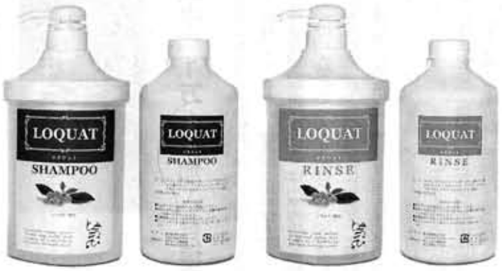
誕生したシャンプー&リンス『ロクワット』

その後、構想から1年半、望の無添加のシャンプー&リンス「ロクワット」が発売された。06年3月にリンズ「ロクワット」が発売された。その日、構想から1年半、望の無添加のシャンプー&リンス「ロクワット」が発売された。その日、構想から1年半、望の無添加のシャンプー&リンス「ロクワット」が発売された。